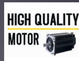
HIGH QUALITY MOTOR MOTEUR AVANCEMENT ET COUPE CONÇU POUR LA VIE DU PRODUIT