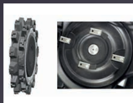
ROUES ET PLATEAU DE COUPE AUTONETTOYANT